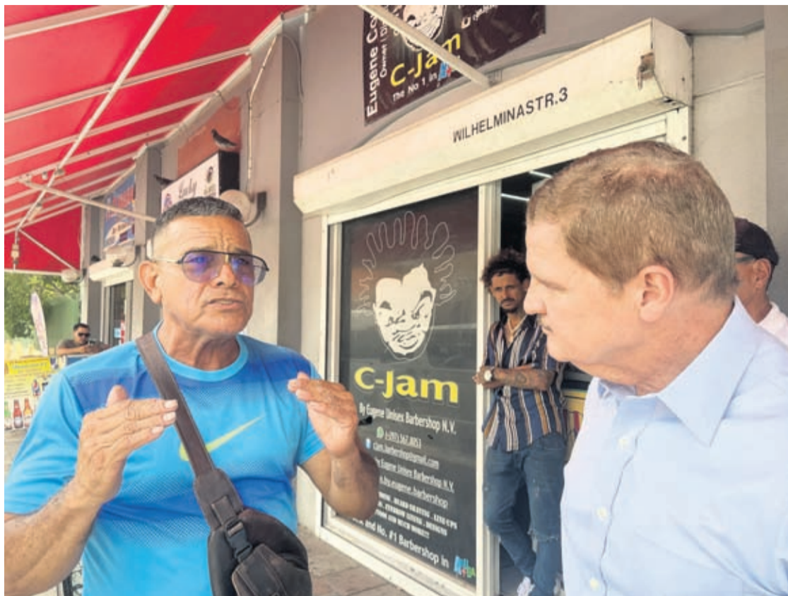
E chauffeurnan di bus chikito no ta kere mucho mas den

Diamars atardi, reportero di Bon Dia Aruba a bolbe acerca algun chauffeur di bus chikito pa mira nan reaccion tocante e siguiente aumento den prijs di diesel y gasolin y con ta sigui cu nan. Bon Dia Aruba a bishita nan algun siman atras caba riba esaki. Na mes momento por a compronde cu parlamentario Mike Eman lo mester a bini pa presenta nan cu un proposicion cu e ta bay hiba Gobierno di Aruba.